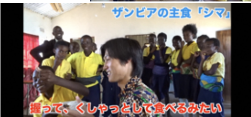
ザンビアの主食「シマ」 握って、くしゃっとして食べるみたい

「子どもたちに自信をもってほしい。」今回は、同じ思いをもった友人たちと協力して行った文化交流について紹介します。