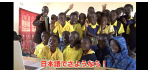
日本語でさようなら!