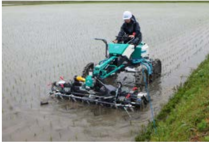
図1 乗用型水田除草機 (株式会社オーレック製 WEED MAN SJ600)

※作業機が前方に配置されており、回転レーキで株間の雑草を除草し、除草ローターで条間の雑草を除草する。