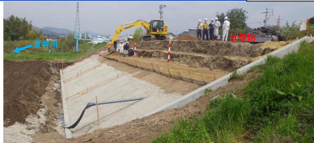
堤防護岸 コンクリート張ブロック施工中 施工状況 (令和2年4月27日)