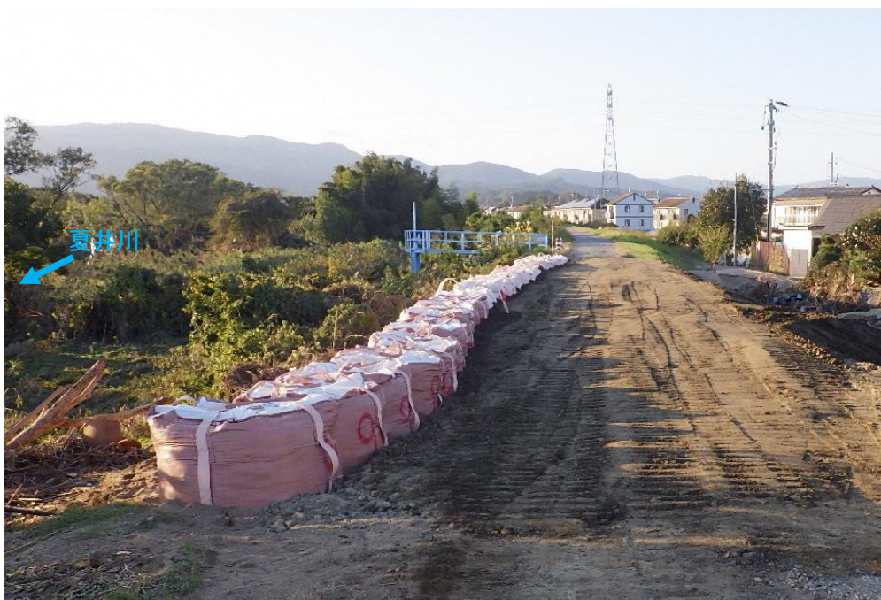
被災状況 (令和元年10月18日撮影)