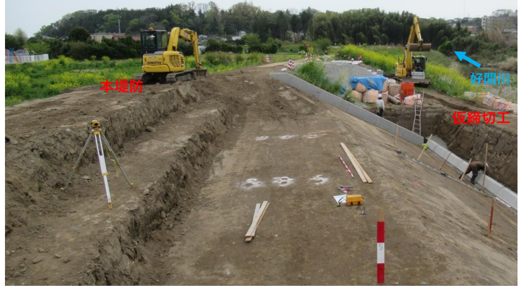
仮堤防設置完了、堤防盛土施工中