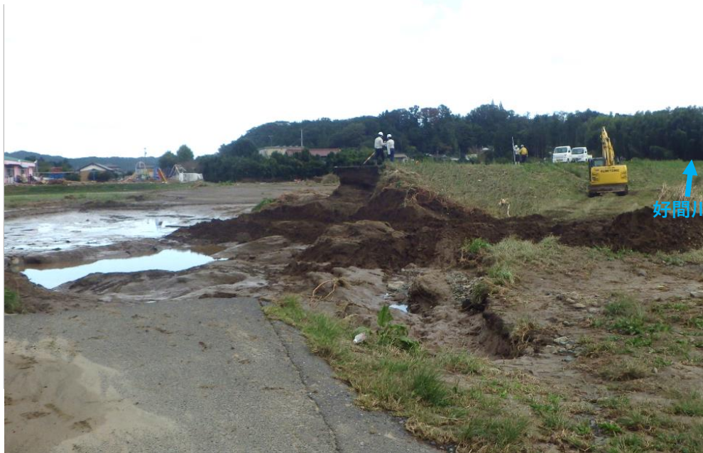
被災状況 (令和元年10月13日撮影)