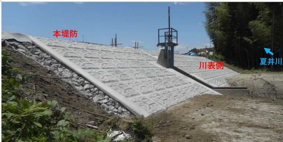
川表側 護岸工完了