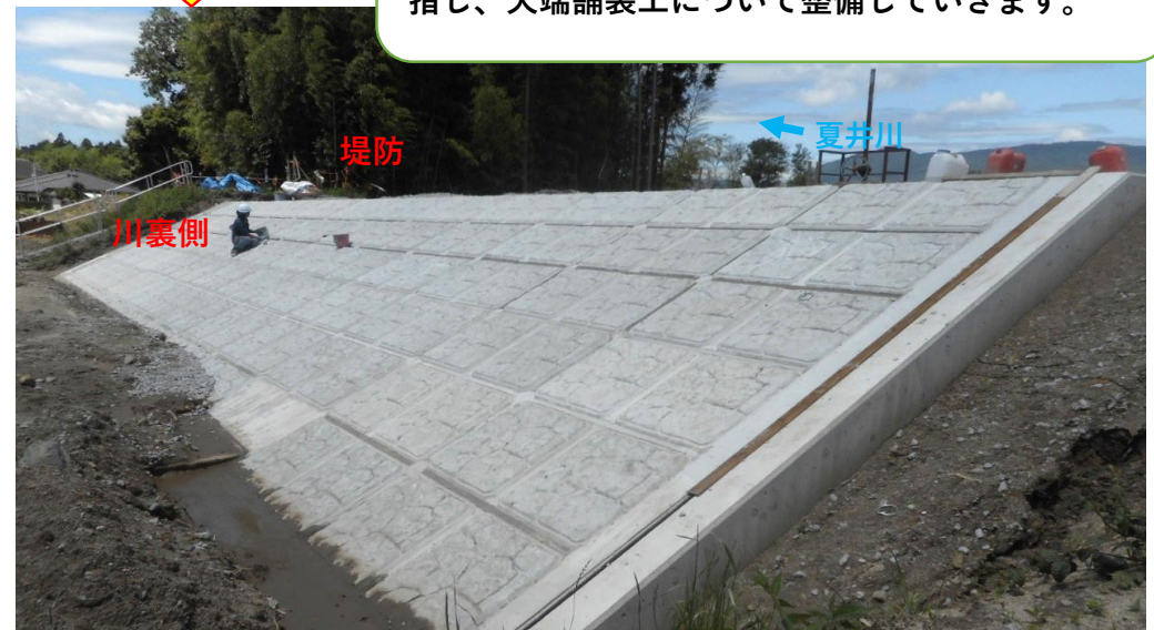
川裏側 護岸施工状況

5月末に川表側の護岸が完成し、6月末に川裏側の護岸が完成しました。引き続き、早期の完成を目指し、天端舗装工について整備していきます。