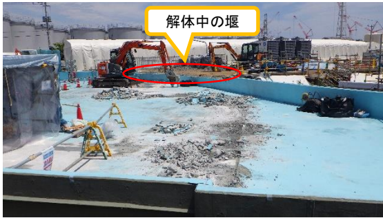
(写真2) 北西タンクエリアの堰内の状況 南西側から撮影