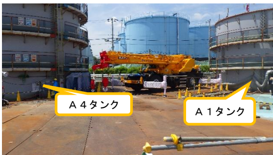
(写真1-1) 南東タンクエリアの状況 北東側から撮影