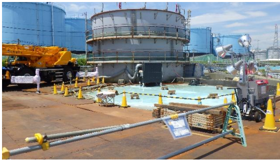
(写真1-3) A1タンク外観 最上段のフランジ部分のみ解体済み 東側から撮影