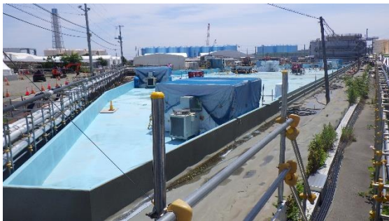
(写真1-4) 北西タンクエリアの状況 北西側から撮影