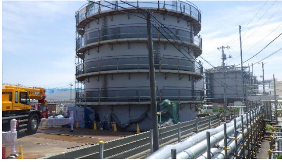
(写真1-2) A4タンク外観 西側から撮影