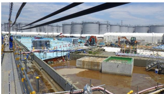
(写真1-5) 北西タンクエリアの状況 南側から撮影