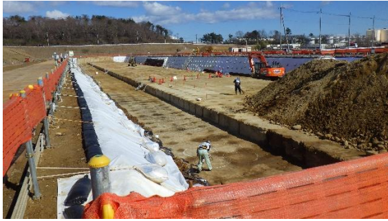
(写真1-1) 南西側から撮影 (前回撮影：令和2年2月28日)