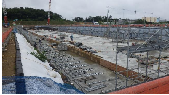
(写真1-2) 南西側から撮影 (今回撮影：令和2年6月23日) ※写真奥側が1工区、手前側が3工区