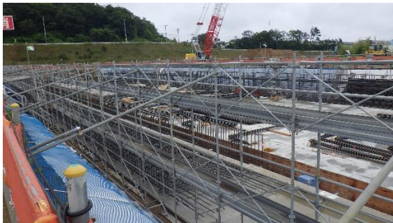
(写真1-3) 基礎構築に向けた配筋作業の状況 (1工区)