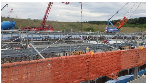
(写真3) 中工区の作業状況 (コンクリート打設作業)