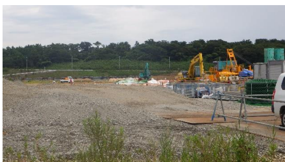
(写真5) 整備工事の様子