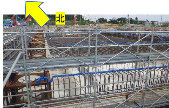
(写真2-1) 南西側から撮影 (前回撮影：令和2年8月20日) ※写真奥側が北工区、手前側が南工区