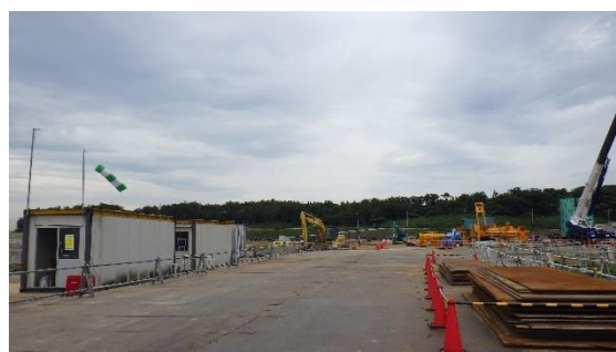
(写真4-2) 搬入路の整備状況 (今回撮影：令和2年9月18日)