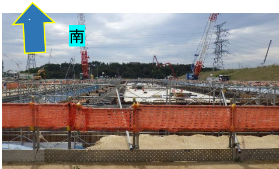
(写真2-3) 北側から撮影 (今回撮影：令和2年9月18日) ※写真奥側が南工区、手前側が北工区