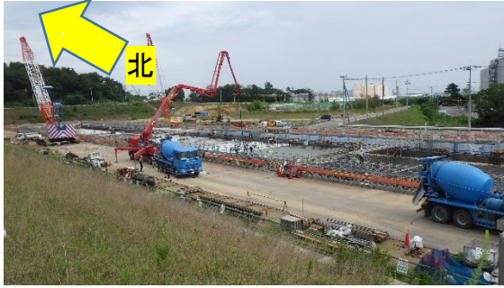
(写真1) 大型廃棄物保管庫建設予定地の状況