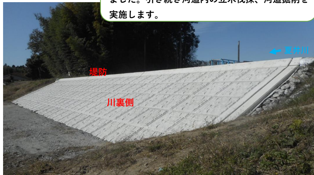
川裏側 コンクリート張ブロック完了 (6月末)

令和元年東日本台風により破堤した堤防について川表側護岸、川裏側護岸、天端舗装が全て完了しました。引き続き河道内の立木伐採、河道掘削を実施します。