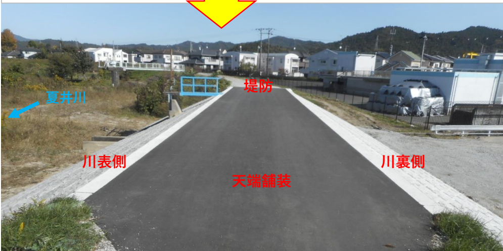
天端舗装完了 (8月末)