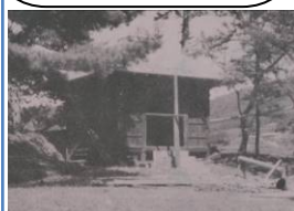
小学校創立当時の建物

本校は、明治7年に開校し、今年で146年。歴史を紐解けば地域の方の血のにじむような努力を垣間見ることができる。さて、本校は、今年度で閉校となる。子どもたちが将来夢をもちよりよく生きるために必要な、将来生きて働く力：「知恵」、何事にも挑戦する力：「勇気」、相手に伝える力：「表現力」をキーワードとして取り組んでいる。そこに、キャリア教育、ICTの活用、地域のよさを生かした体験活動を関連付けたことで、日々子供たちが成長する姿を見ることができる。