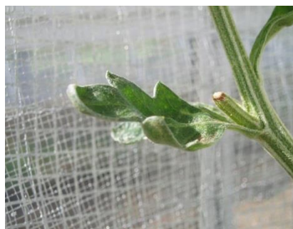
品目：きく 症状：葉の異常