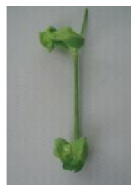
ひどく変形し原型をとどめない =3