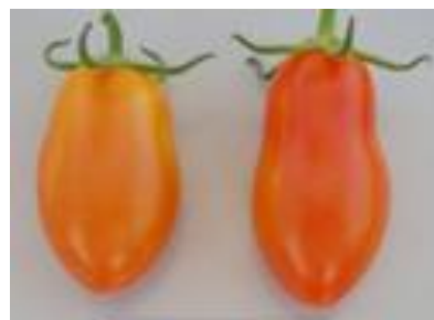
品目：ミニトマト 症状：果実が細長く変形