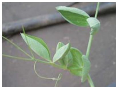
品目：さやえんどう 症状：葉がカップ状になる