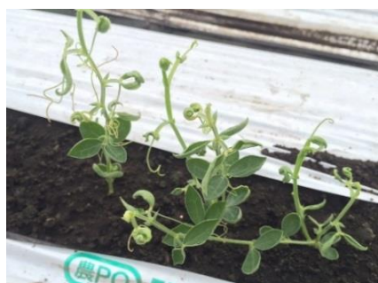
品目：スイートピー 症状：葉の異常