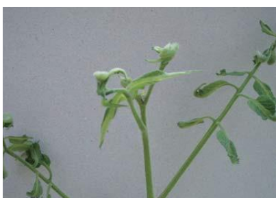
品目：トマト 症状：葉の異常