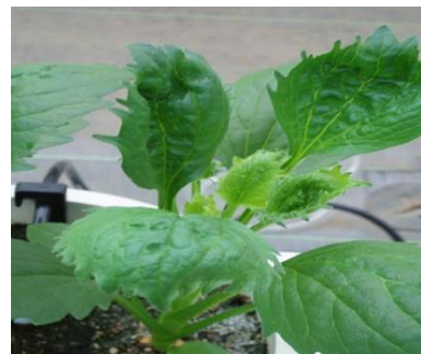
品目：アスター 症状：葉の異常