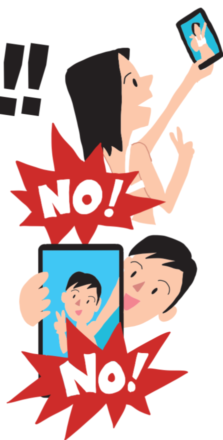
自撮り被害に遭った児童の推移(全国)

コミュニティサイト等で知り合った人に、自分の裸や下着姿の写真を送られる「児童ポルノ自撮り被害」が急増しています。裸や下着姿の写真を撮ってはいけませんし、絶対に送ってはいけません。