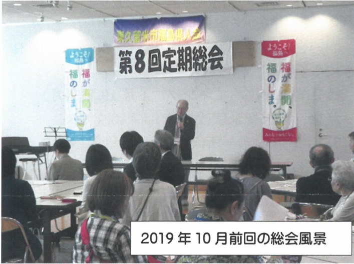
2019年10月前回の総会風景