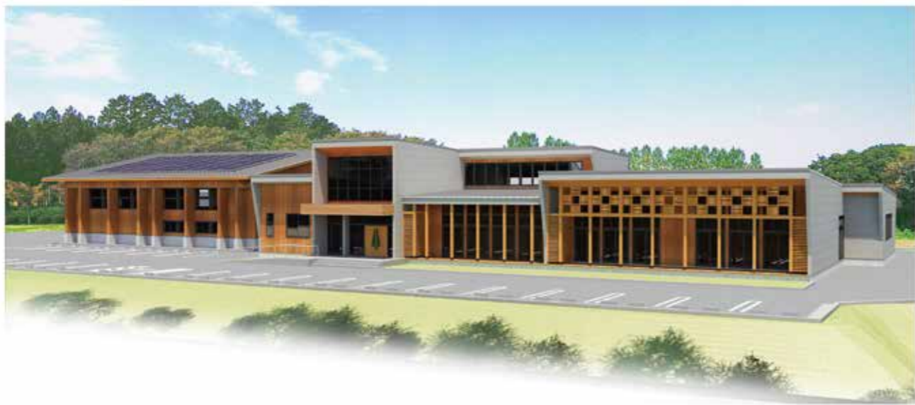
※研修施設パース(予定)