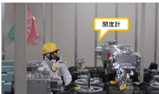
(写真 2) 開度計を確認する様子