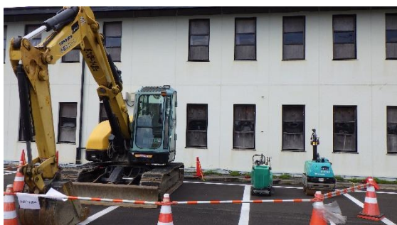
（写真3） 重機の仮置きの様子 （旧研修棟南側）