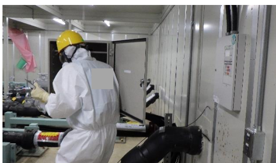
(写真 1) 集中監視室と連絡を取る様子