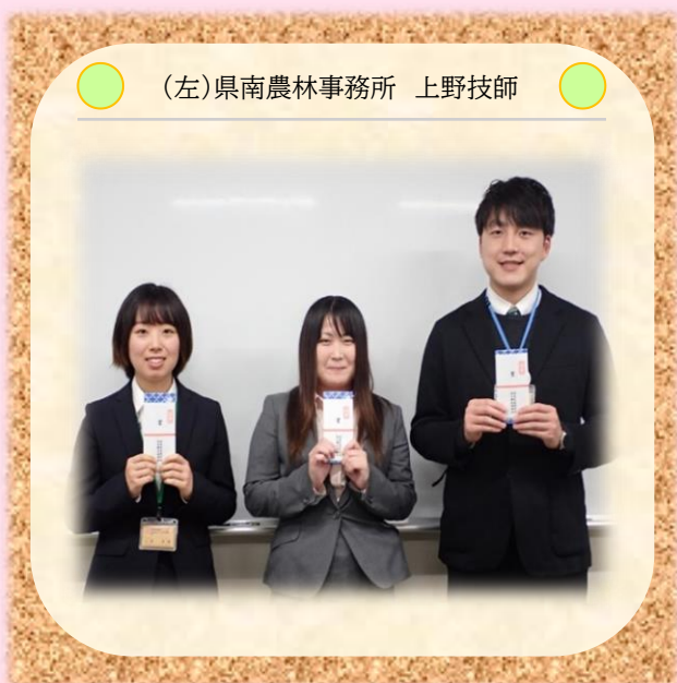
(左) 県南農林事務所 上野技師

1月28日(木)に、「令和2年度福島県農業普及指導活動成果発表会」が開催され、各農林事務所の代表者が普及活動の成果を発表しました。