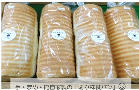
手・まめ・館自家製の「切り株食パン」😊