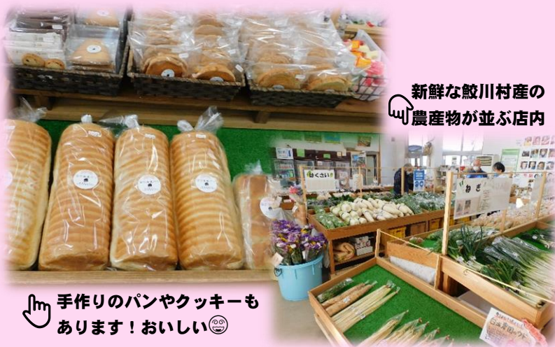
新鮮な鮫川村産の農産物が並ぶ店内