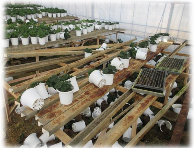
↑地震によって損傷した鉢花