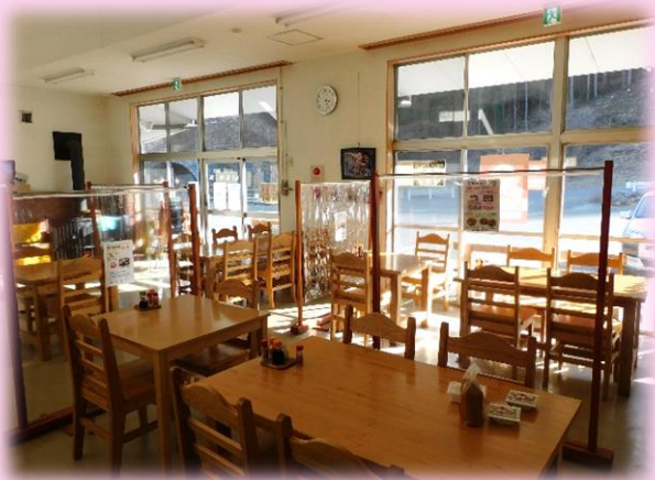
席同士はパーテーションで仕切られており、コロナ対策もバッチリです！