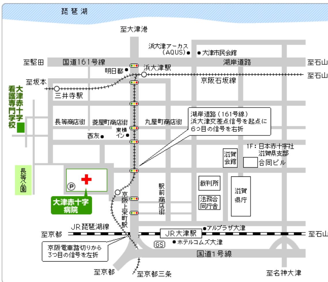
(大津赤十字病院周辺地図)