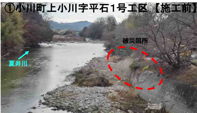
①小川町上小川字平石1号工区【施工前】