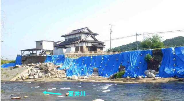
②小川町上小川字中島工区【施工前】