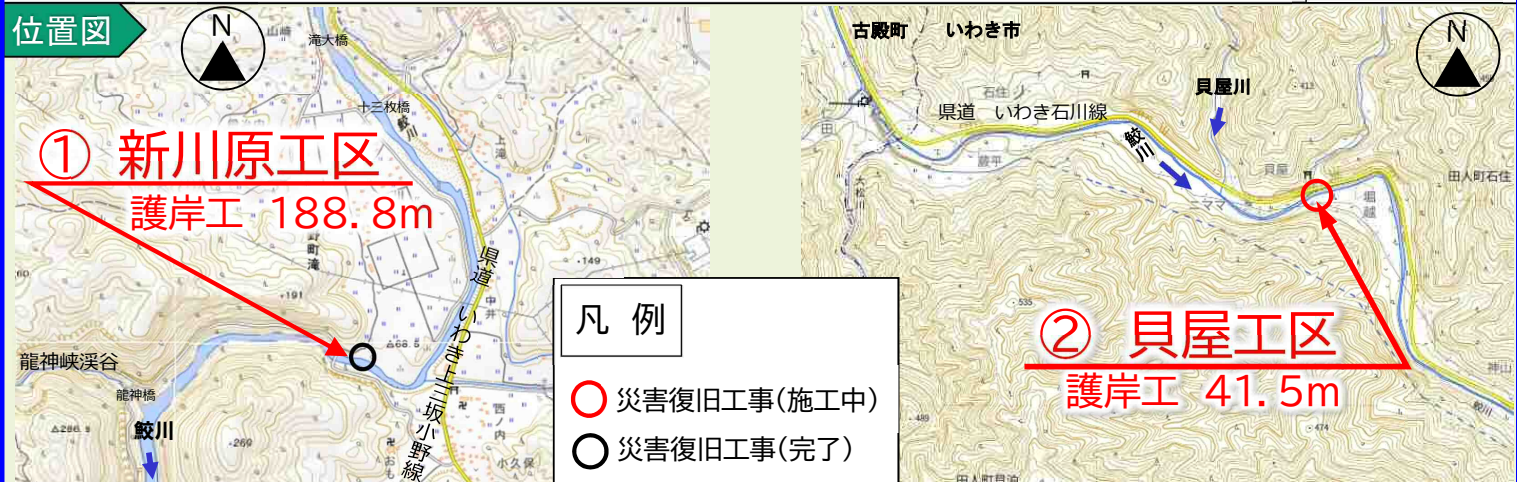
写真 現在、災害復旧工事を実施している代表的な箇所を掲載しています。