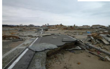
路面・橋梁の流失