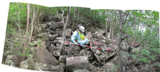
落石危険箇所 (道路斜面に浮石が多数)

落石が発生した箇所や道路の斜面に浮石があり落石の危険がある箇所について、落石の発生を予防する落石防護網や落石から道路を防護する落石防護柵を設置します。