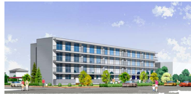
※県営復興公営住宅のイメージです。