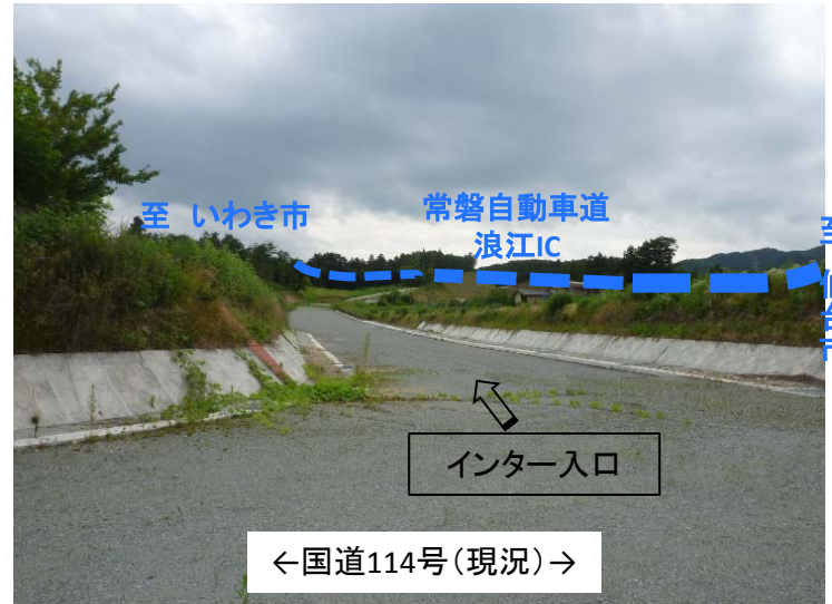
吉間田滝根線 広瀬工区 国道114号 室原工区