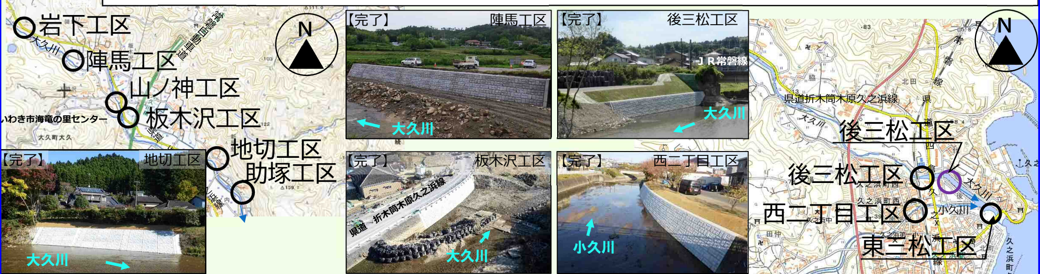
写真 大久川の復旧工事は全て完了しました。次号からは夏井川についてお知らせします。

位置図 凡例 ○ 災害復旧工事(施工中) ○ 災害復旧工事(完了) ○ 交付金工事(完了)