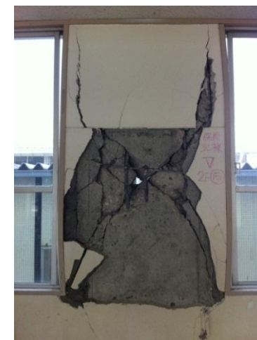
柱のせん断破壊の状況