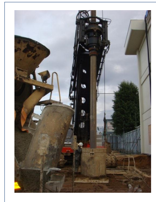
杭工事の様子（ケーシング工法）