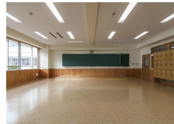
完成写真 (外観・内観)