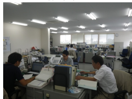
新庁舎執務室内の様子