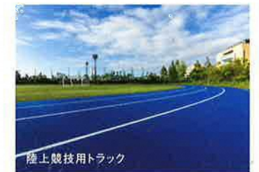
陸上競技用トラック

400m×4コースの陸上競技用トラックを併設したフィールドは夜間の照明も完備。陸上競技をはじめ、さまざまな競技のフィジカルトレーニングやサッカー・ラグビー・アメリカンフットボール等、多目的に使えるフィールドです。