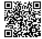
社会教育課 ホームページ

令和3年度 ふくしまを十七字で奏でよう絆ふれあい支援事業最優秀作品より 〈絆部門〉 「うっせいわ」ねえお母さん「はら減った」「子」「はいはいはい」それでも楽しい 反抗期【母】 〈いもむすぶ部門〉 いもむすと 海まで競争 階段のぼり【子】 堤防の 高さの意味を 子に伝え【父】