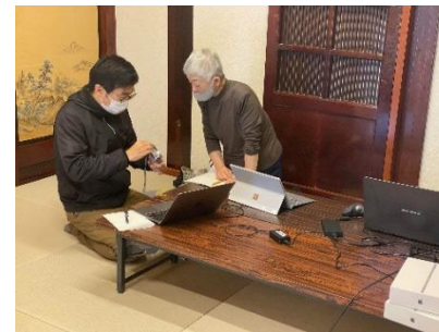
機器の使い方についての相談

第5章 戦略の推進 3. デジタルデバインド対策 より抜粋 『西会津町は高齢化率が高いことから、相談対応をはじめ、特に高齢者のデジタル技術についての理解、利活用を支援するため、関係者が連携した仕組み、体制により取組みを進める。』