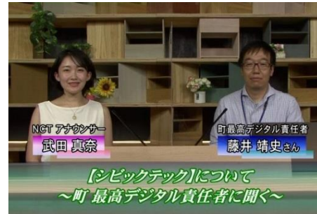
ケーブルテレビ特別番組を制作・放映