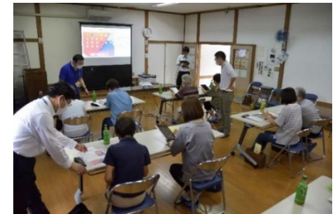
自治区集会所でのデジタル教室