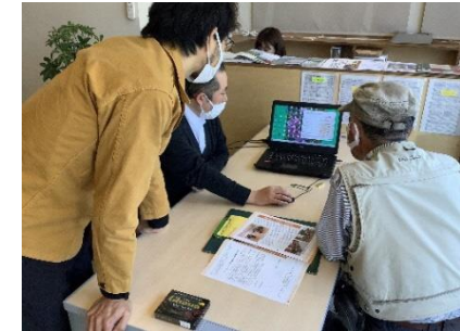
パソコンの不具合への対応