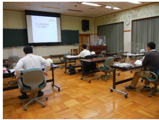
講義の様子②（原子力関係法令）