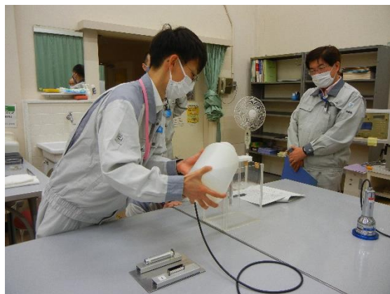
実習の様子①（中性子実験）