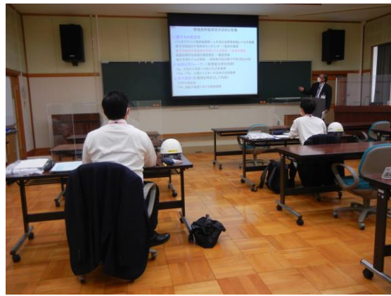
講義の様子①（環境放射能測定）