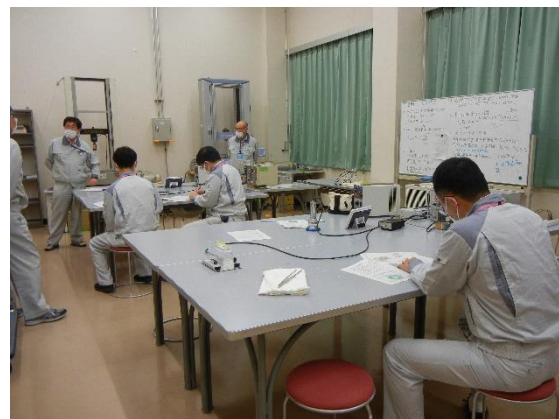
実習の様子②（中性子実験）