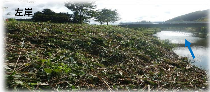
上流から下流を望む