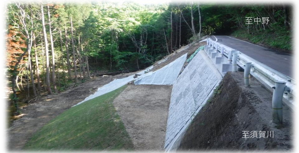
中野方面から須賀川方面を望む