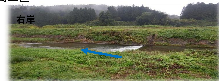
上流(左岸)から下流を望む