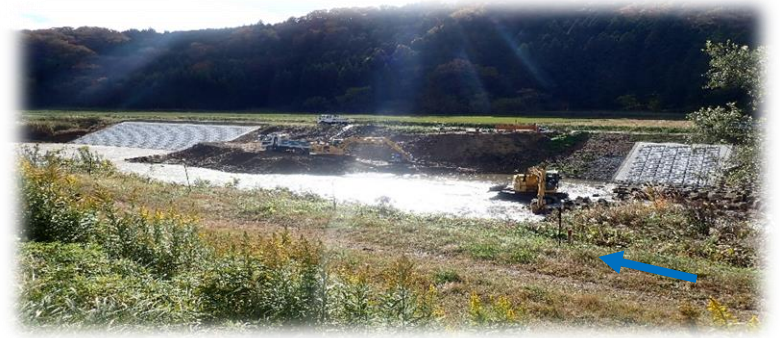
上流(左岸)から下流を望む