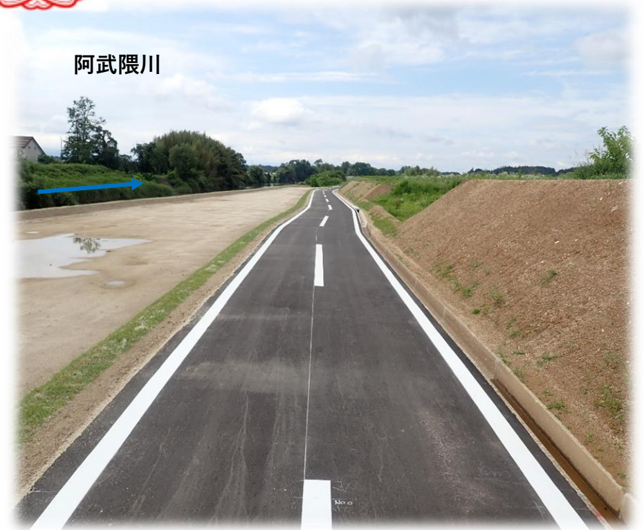
須賀川方面から二本松方面を望む