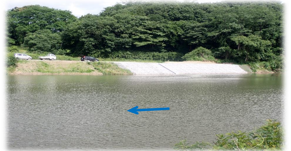
左岸から右岸を望む