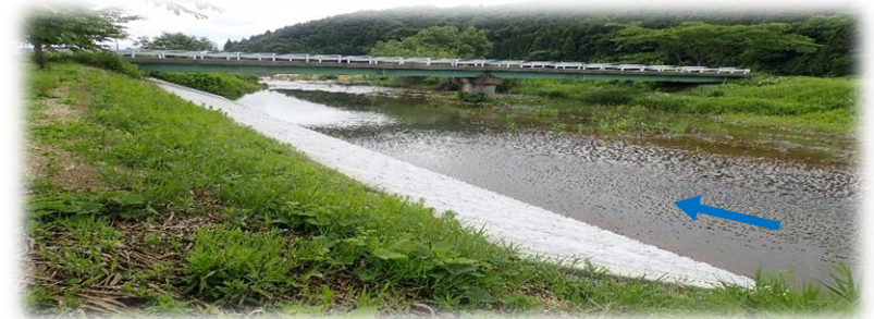
上流から下流を望む