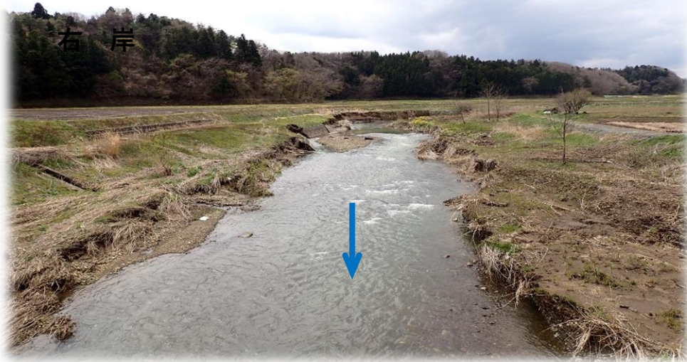
里橋から上流側 下流から上流を望む