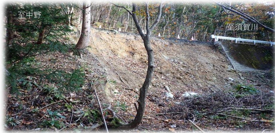
中野方面から須賀川方面を望む