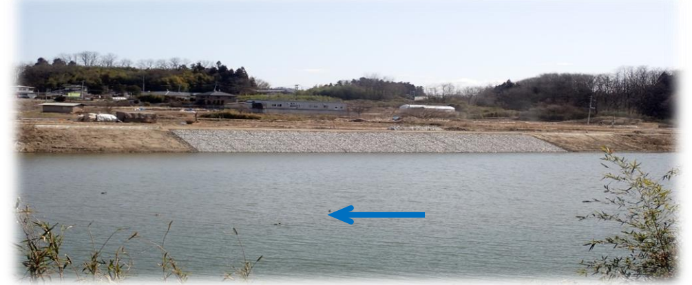
左岸から右岸を望む