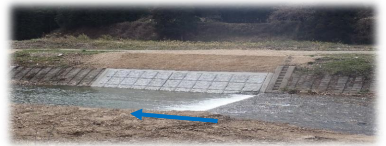
上流(左岸)から下流を望む