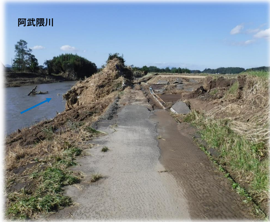
須賀川方面から二本松方面を望む