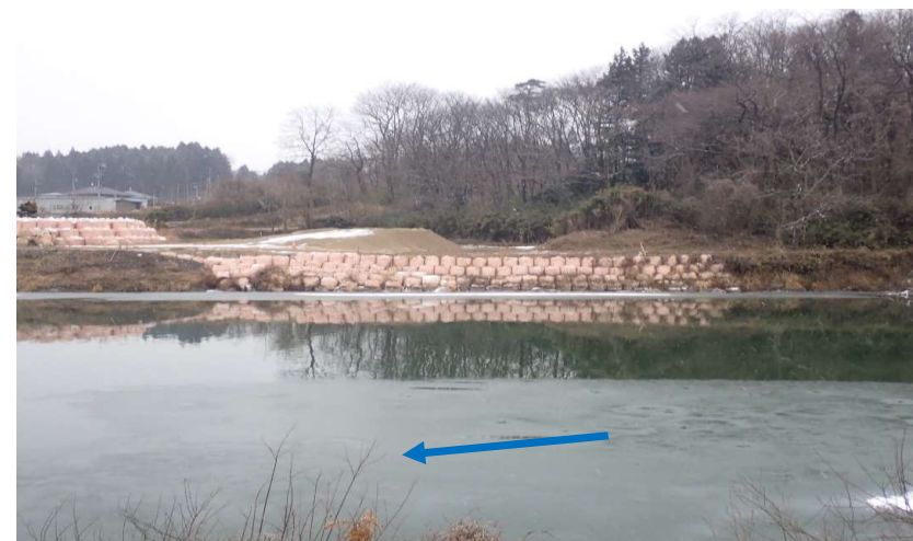
左岸から右岸を望む