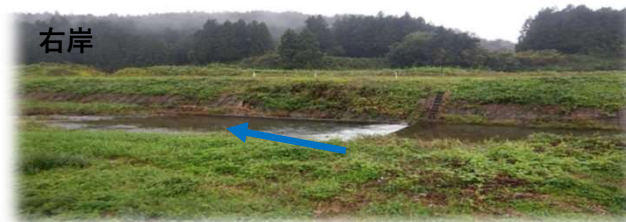
上流(左岸)から下流を望む