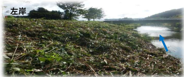
上流から下流を望む