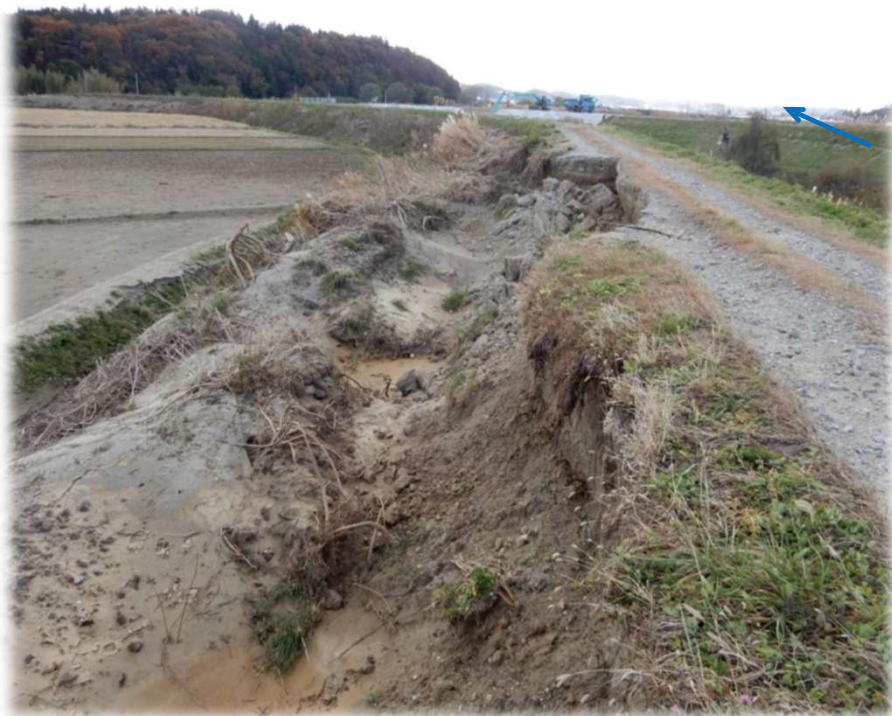
上流から下流を望む