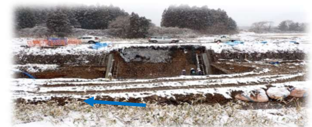
上流(左岸)から下流を望む