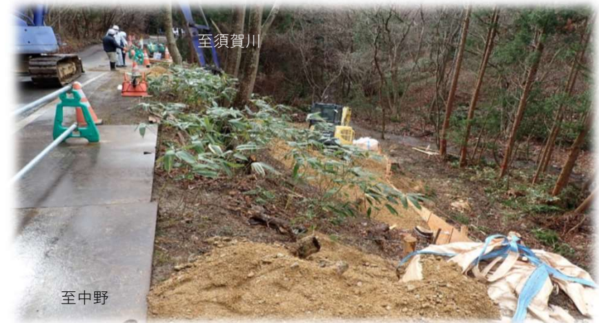
中野方面から須賀川方面を望む