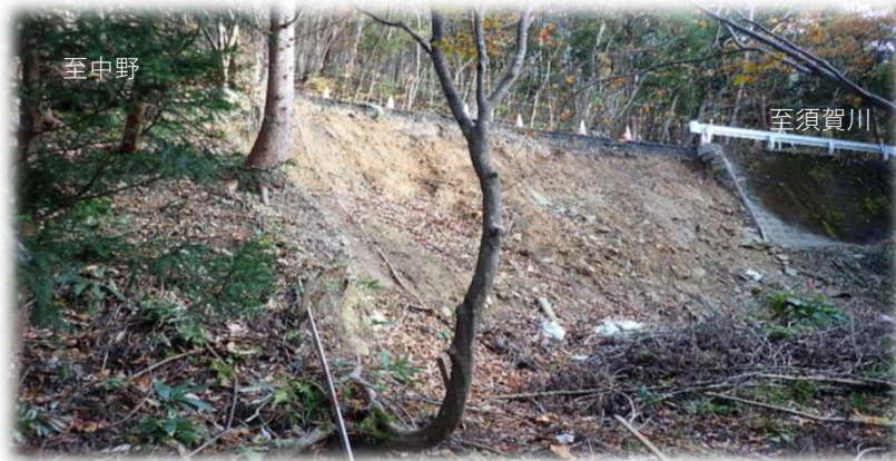
中野方面から須賀川方面を望む