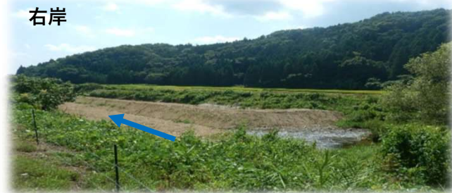
上流(左岸)から下流を望む