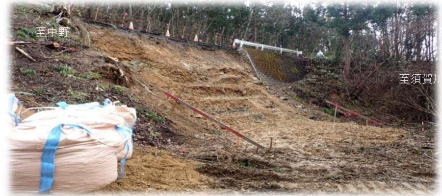
中野方面から須賀川方面を望む