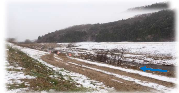
上流(左岸)から下流を望む