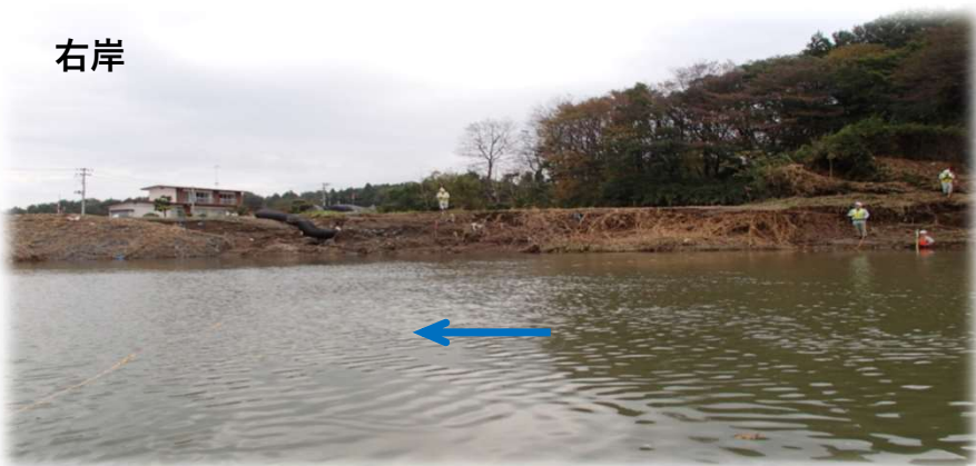
左岸から右岸を望む