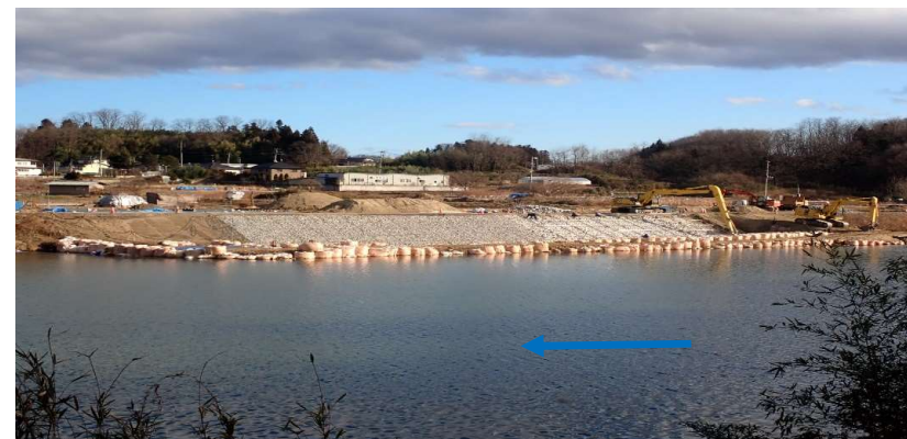
左岸から右岸を望む