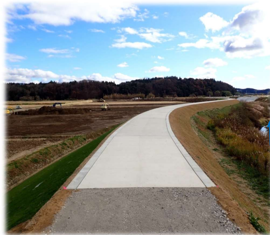
下流から上流を望む