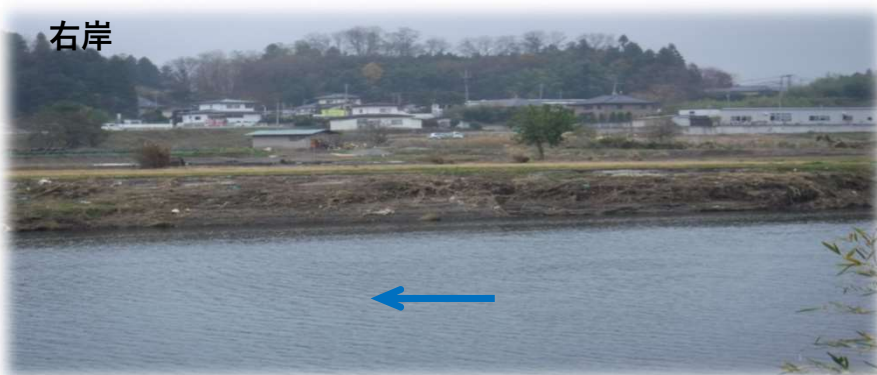
左岸から右岸を望む