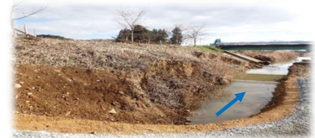
上流から下流を望む