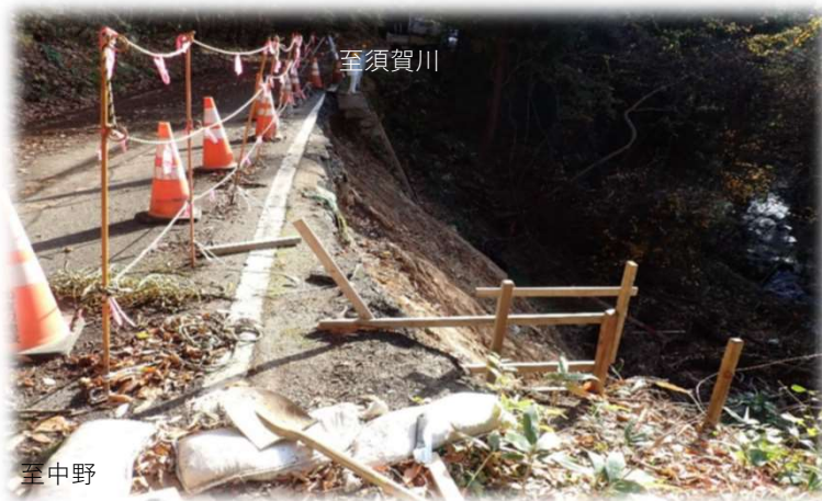
中野方面から須賀川方面を望む