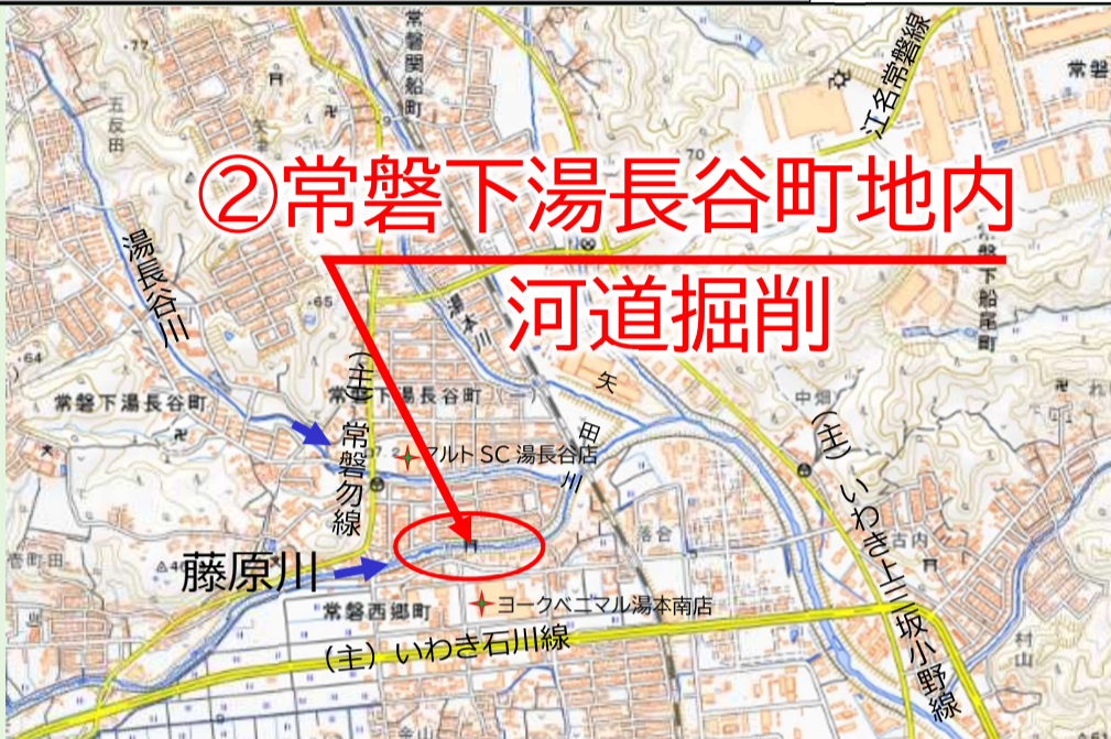
写真 藤原川で実施している工事の代表的な箇所を掲載しています。