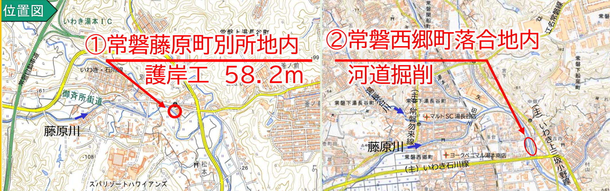
写真 藤原川の災害復旧や河道掘削等の工事状況について代表的な箇所を掲載しています。