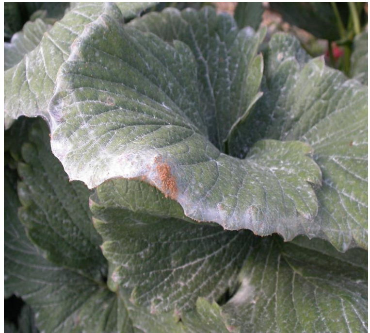
写真2：ナミハダニによるかすり状の被害痕