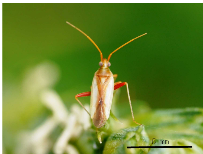
写真1 アカスジカスミカメ

(アカヒゲ：アカヒゲホソミドリカスミカメ、ホソハリ：ホソハリカメムシ、オオトゲ：オオトゲシラホシカメムシ、クモヘリ：クモヘリカメムシ、コバネ：コバネヒョウタンナガカメムシ、アカスジ：アカスジカスミカメの略)