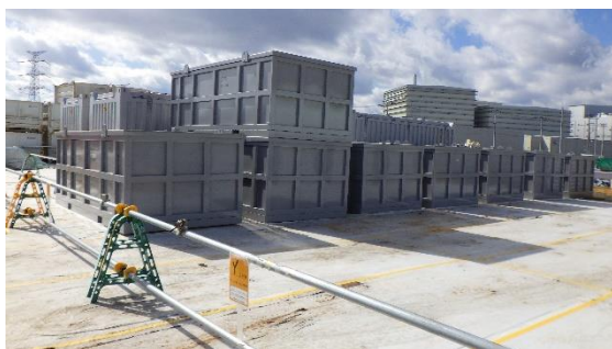
(写真3-2) 解体品コンテナ収納エリアの状況② (北東側から撮影)