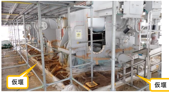
(写真2) 主変圧器下部の状況 (養生シート内部を北西側から撮影)