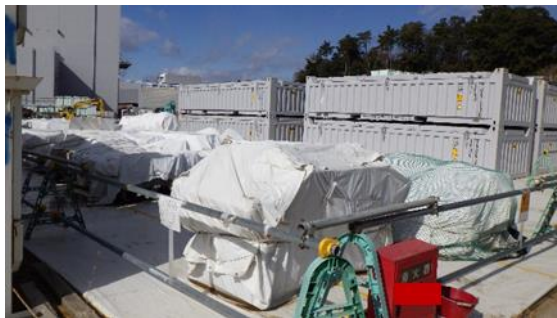
(写真3-1) 解体品コンテナ収納エリアの状況① (南東側から撮影)