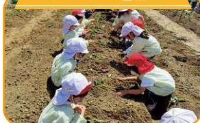
サツマイモの苗植え