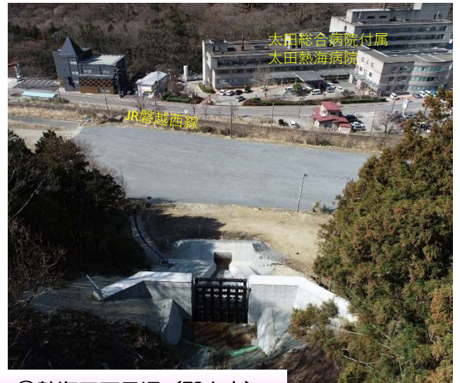
⑧熱海五丁目沢(郡山市)