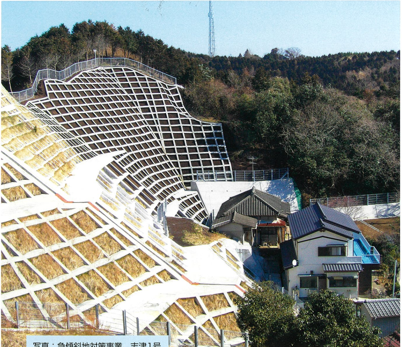
写真：急傾斜地対策事業 志津1号 いわき四倉町志津地内 (平成17年度完成)