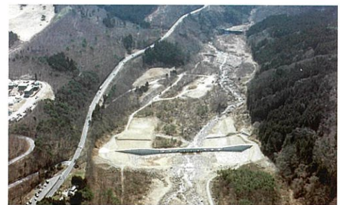
荒川流砂地（福島市）

吾妻山及び安達太良山火山砂防地域の荒川流域から県都福島市の市街地周辺に流出される有害な土砂を抑制・調整し、土砂災害を未然に防止するため、対策事業を推進する。