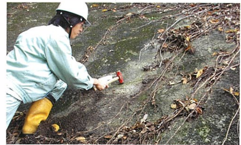
モルタル劣化状況調査