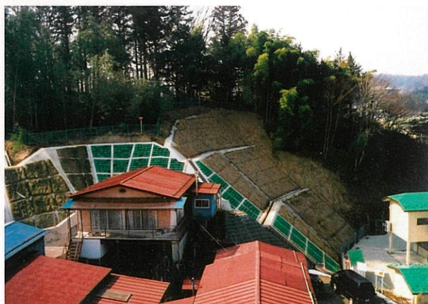
竹田一丁目（二本松市）

がけ崩れにより、人命や財産に被害を及ぼすおそれのある箇所において、近年、がけ崩れ被害のあった箇所や災害時要援護者関連施設のある箇所、また、地域防災計画における避難路及び避難場所がある箇所を主体に、緊急性の高い13箇所の整備を図る。