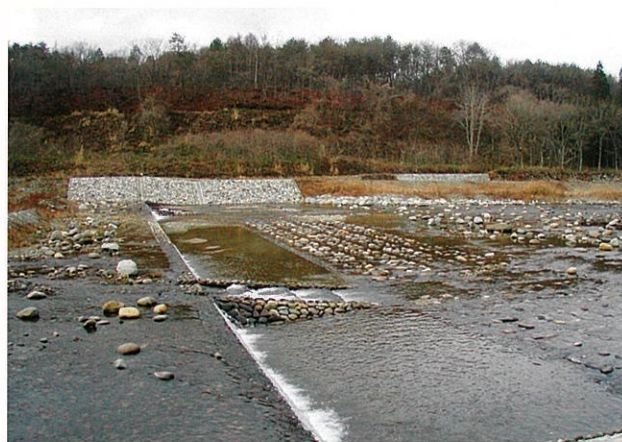
加藤谷川（下郷町）（火山砂防事業）

土砂災害発生箇所に再発災害防止のため、災害関連緊急砂防等事業と一体的な計画に基づき緊急的に3箇所の整備を行う。