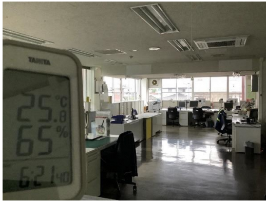
(消灯後) 18:20 ごろ