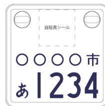
通常の原付よりも小型化！