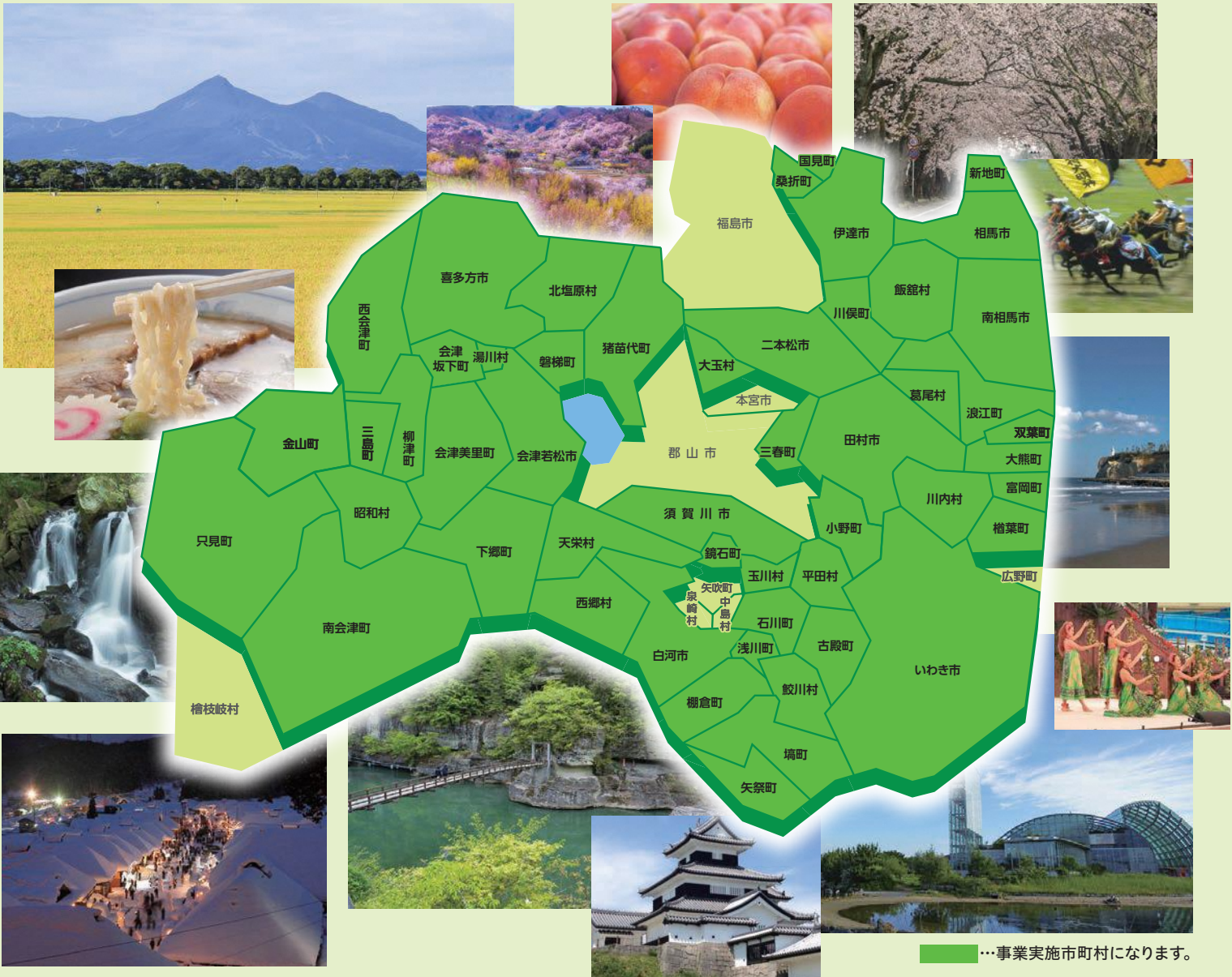
…事業実施市町村になります。

福島県は、人口減少対策と地域創生の実現を図るため、移住・定住の促進、地域の活性化及び良質な住宅ストック形成の観点から、福島県内に移住・定住するために住宅を取得する方に、市町村と共同で補助を行います。海あり山あり温泉あり、歴史、伝統、祭り、四季折々の観光やレジャーに加えて、海の幸、山の幸、日本酒など、年間を通じて魅力満載の福島県で暮らしてみませんか!