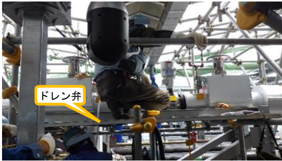
(写真3-2) ドレン弁の確認状況