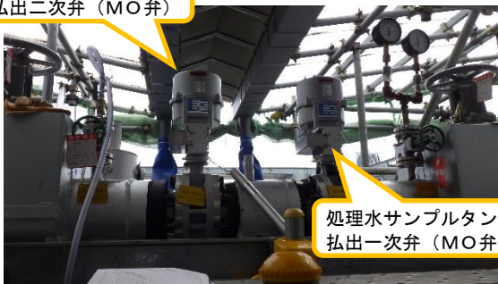
(写真1) B群処理水サンプルタンク払出弁 (MO弁) の設置状況