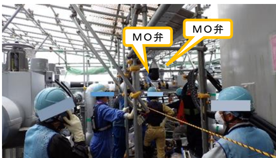
(写真2) MO弁シートパス確認作業の状況