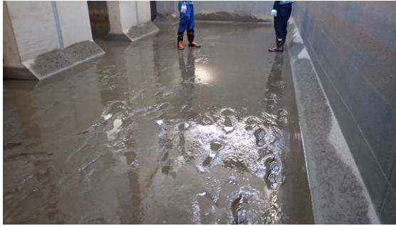
(写真1) 上流水槽床面（南側）の状況