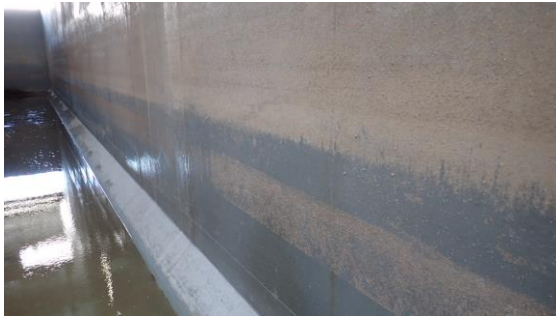
(写真2) 上流水槽壁面の状況 （土砂の付着状況）