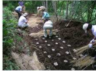
野外埋め込みによる栽培