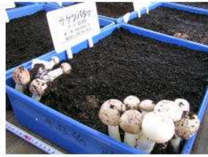
パーク堆肥埋め込みによる箱栽培