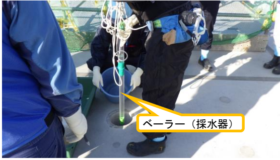
(写真 2 - 1) 放水立坑（上流水槽）からの試料採 採取の状況①