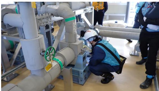
(写真1-1) 処理水移送ポンプ(A)の稼働状況 確認の状況