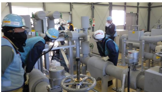
(写真1-2) 処理水移送配管等の確認状況