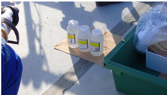
(写真 3) 採取した分析用試料の状況