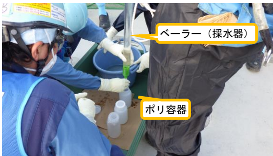
(写真 2 - 2) 放水立坑（上流水槽）からの試料採 採取の状況②