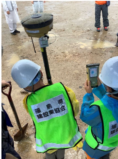
測量機器を用いた宝探し体験