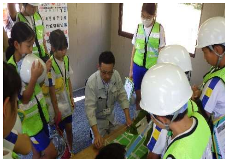
土砂災害模型実験