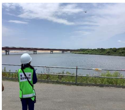
ドローン操作体験