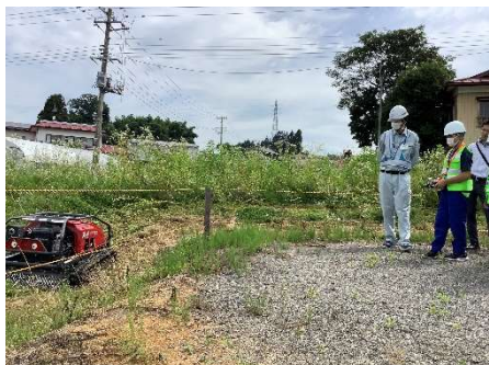
リモコン草刈り機操縦体験