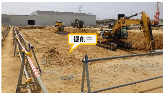
(写真 2 - 1) 固体廃棄物貯蔵庫第 1 0 棟 (B 棟) 建設予定地の状況 (令和 5 年 4 月 1 4 日撮影)