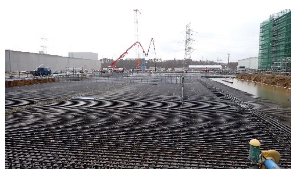
(写真 3 - 2) 固体廃棄物貯蔵庫第 1 0 棟 (C 棟) 建設予定地の状況 (令和 6 年 1 月 2 2 日撮影)