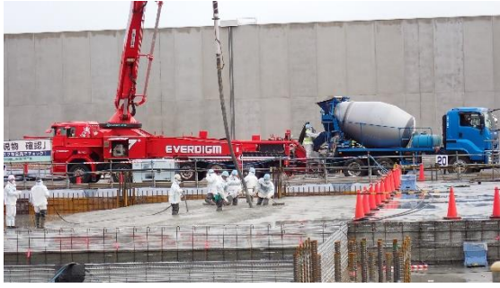
(写真3-3) 基礎設置のためのコンクリート打設 作業状況 (令和6年1月22日撮影)