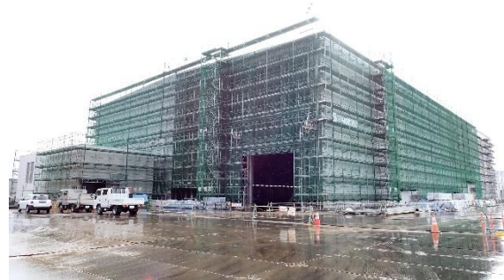
(写真 1 - 2) 固体廃棄物貯蔵庫第 1 0 棟 (A 棟) 建設予定地の状況 (令和 6 年 1 月 2 2 日撮影)