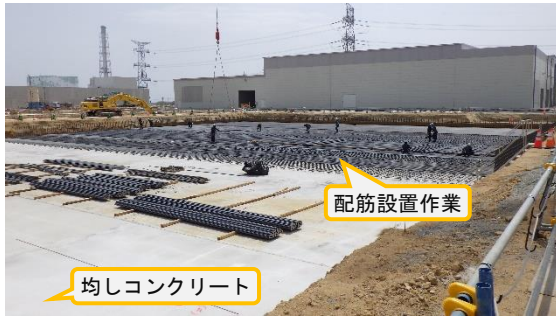
(写真 1 - 1) 固体廃棄物貯蔵庫第 1 0 棟 (A 棟) 建設予定地の状況 (令和 5 年 4 月 1 4 日撮影)