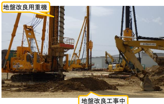
(写真 3 - 1) 固体廃棄物貯蔵庫第 1 0 棟 (C 棟) 建設予定地の状況 (令和 5 年 4 月 1 4 日撮影)