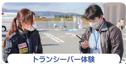
トランシーバー体験