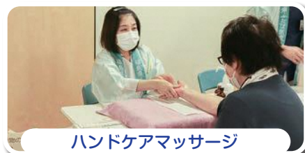
ハンドケアマッサージ