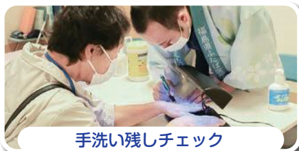
手洗い残しチェック