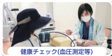
健康チェック(血圧測定等)