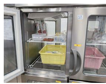
↑奥にも扉があります！

厨房内は、「汚染区域（食材の下処理室など）」と、「非汚染区域（調理室など）」に分かれており、この2つの区域が人の行き来などによって交差してしまうと、食材が汚染されるリスクが高くなります。しかしパススルー冷蔵庫を汚染区域と非汚染区域の間の壁面に設置することで、食材のみを移動させることができ、より衛生的に食材を管理することができます。