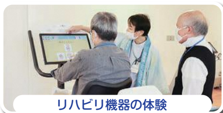
リハビリ機器の体験