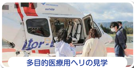
多目的医療用ヘリの見学