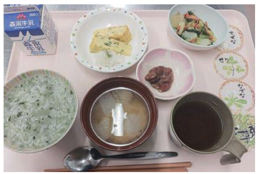
↑人日の節句献立では、七草粥、ふくさ焼き、煮豆を提供しました！

今回はその中から、人日の節句献立についてご紹介します。人日の節句（1月7日）はあまり聞き馴染みがないかもしれませんが、春の七草（せり、なずな、ごぎょう、はこべら、ほとけのざ、すずな、すずしろ）が入った七草粥を食べる日です。これはもともと日本にあった、7種類の野草を入れて作ったお粥を食べ、無病息災を祈るという風習が、中国の風習と混ざったものとされています。