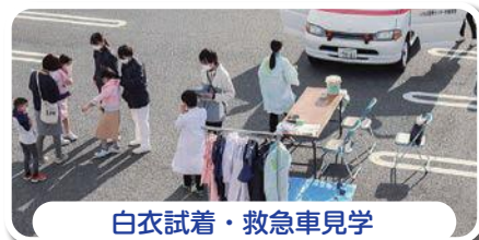
白衣試着・救急車見学