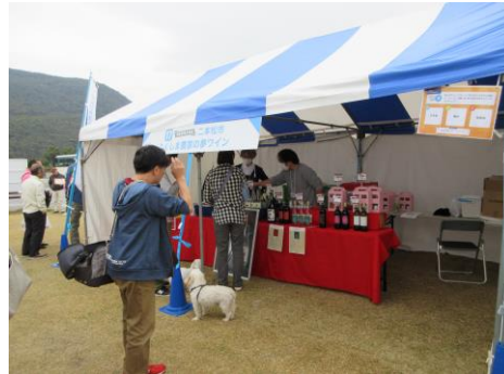
二本松市 (ワインやシードル等)