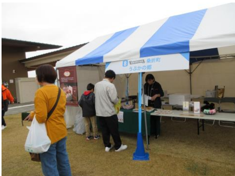
桑折町 (ロイヤルピーチポーク)