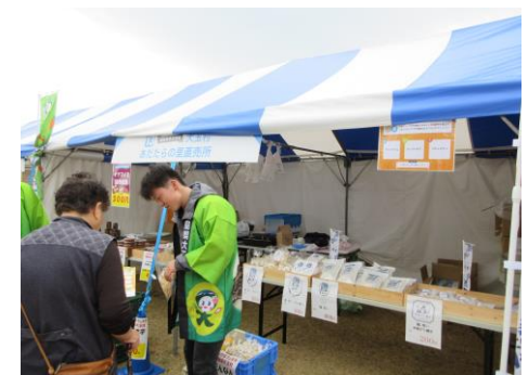
大玉村 (米・野菜等)