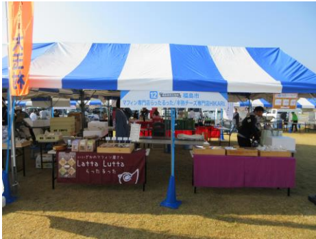
福島市 (マフィン/半熟チーズ)