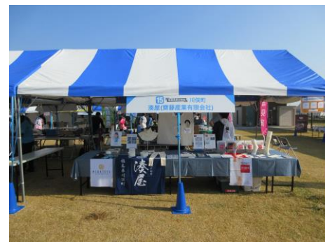
川俣町 (川俣シルク)