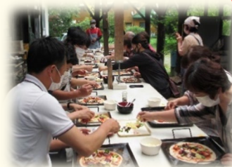
一般社団法人 あぶくまエヌエスネット